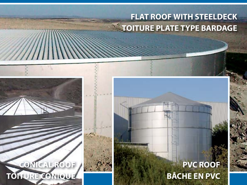
FLAT ROOF WITH STEELDECK TOITURE PLATE TYPE BARDAGE