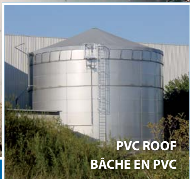
PVC ROOF BÂCHE EN PVC