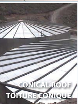
CONICAL ROOF TOITURE CONIQUE